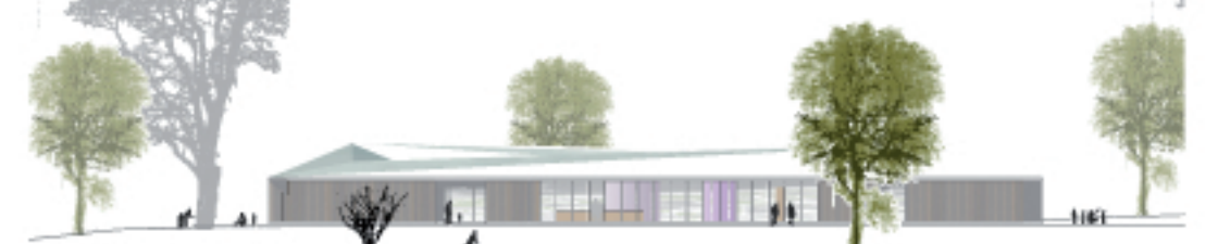
Ansicht Nord M. 1: 200