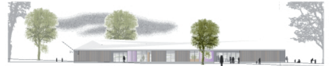
Ansicht Süd M. 1: 200