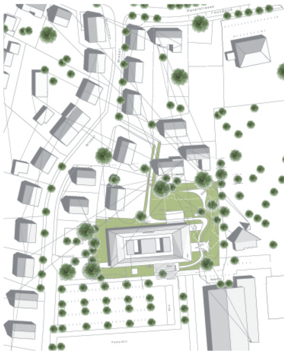
Lageplan M. 1: 500