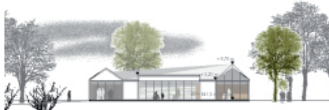
Schnitt 1-1 M. 1: 200