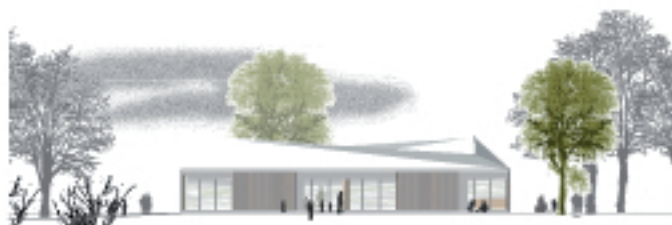
Ansicht West M. 1: 200